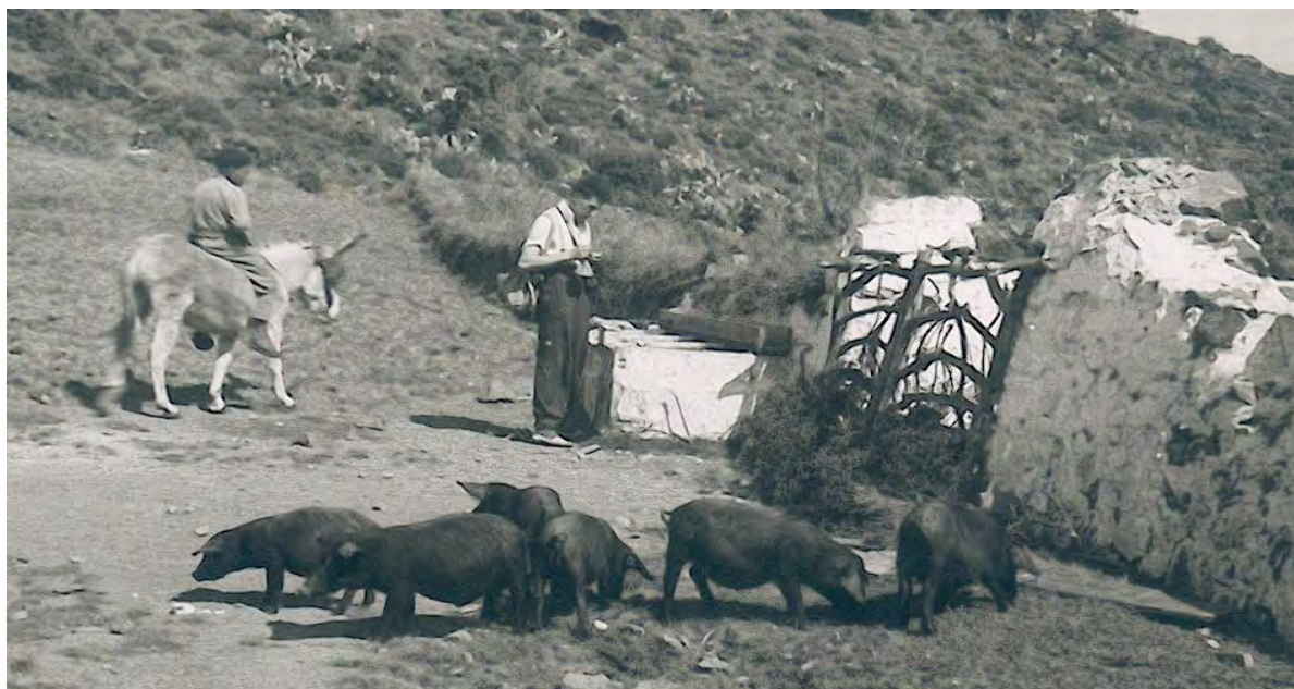
Figura 2. Margalef 'rascando' las algas del abrevadero, en Binillautí de Baix, al norte de Maó, en Menorca, el 19 de marzo del 1951 [a las doce menos cuarto, para interpretar las sombras].

Menorca ya es Reserva de la Biosfera declarado por la UNESCO y ahora está en peligro por las urbanizaciones en aumento, pero entonces aún predominaban las fincas tradicionales -el célebre Lloc menorquí- con su "Amo" muy activo en el campo y ganado, más "es cavall" para las fiestas, y su "Madona" casera. "Es barranc d'Algendar" con Cala Galdana eran deliciosos entonces. Vimos plantas curiosas como Sibthorpia africana L. en el "pas d'en Rebull", una endémica balear que Ramón deseaba conocer por haberla descubierto los Salvador en este barranco y fue mal interpretada por el creador del género Linneo (1751) que la creyó procedente de África, donde solo existe S. europaea L (1753). El arroyo y los manantiales estaban abiertos entonces a todos y eran apropiados para el algólogo de agua dulce y salobre. Estuvimos en Ciutadella dos días y el viernes santo tomó el barco de Mallorca, para pasar la Pascua con María Mir que fue su esposa y un gran apoyo hasta el final de su vida.