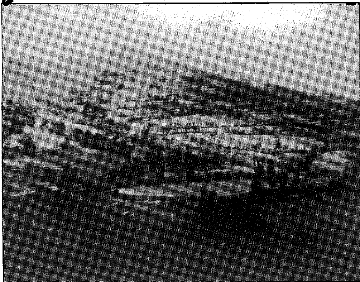
Paisaje de montaña humanizada, en San Juan de Plan, con la impronta cultural comentada que debemos perfeccionar. El ganado en la borda y pueblos limpios con su turismo culinario en aumento.