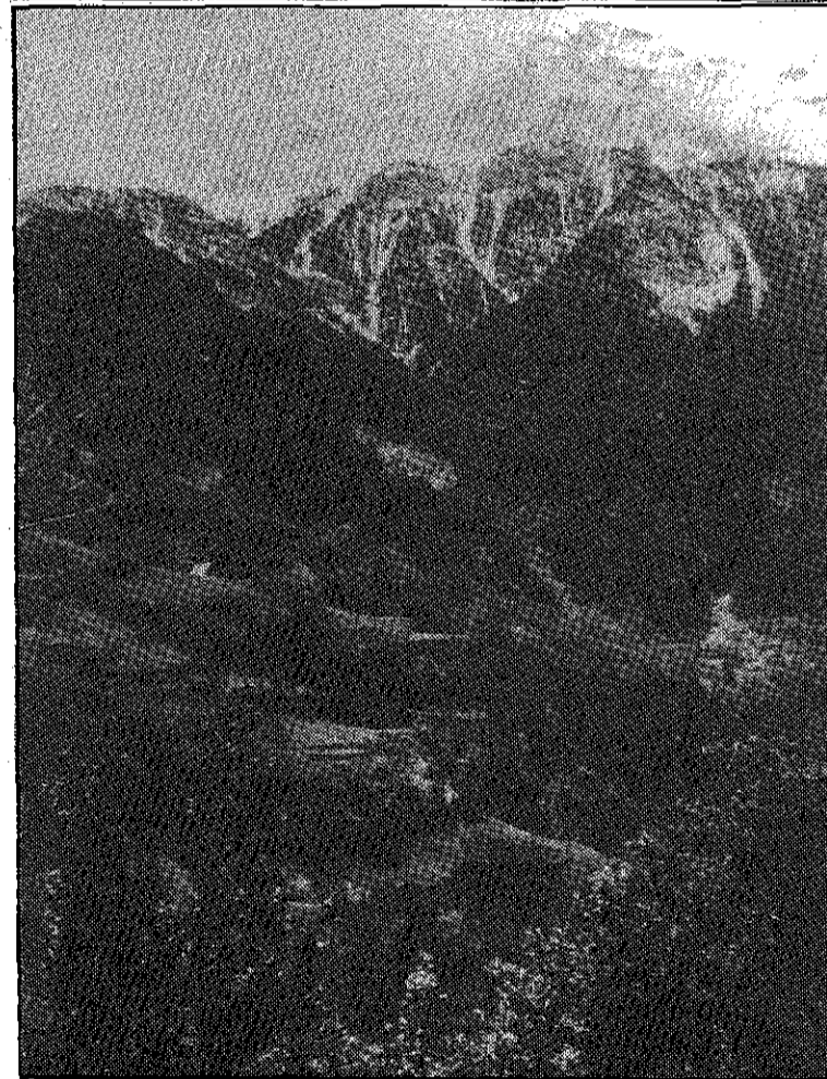
Frajinales de Altra Ribagorza: La pedrería pierde su armonía ancestral por envejecimiento poblacional. Paisaje recuperable para un turismo más integrado